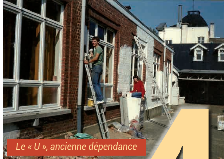
Le « U », ancienne dépendance