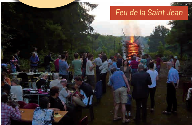
Feu de la Saint Jean