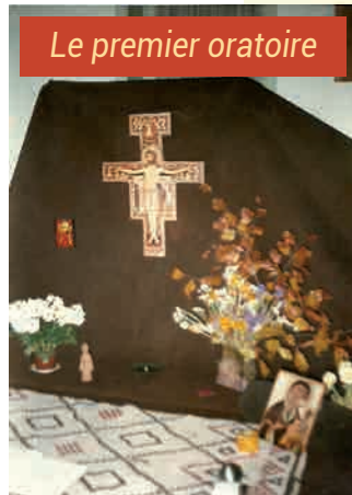
Le premier oratoire